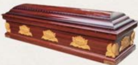
纖維板 - 蓮花款大蓋方箱 (金色蓮花)