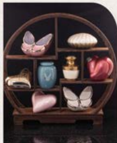
可安放家中小型灰盅及相架