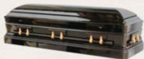
實木 - 香柏木鋼琴面頂級福板