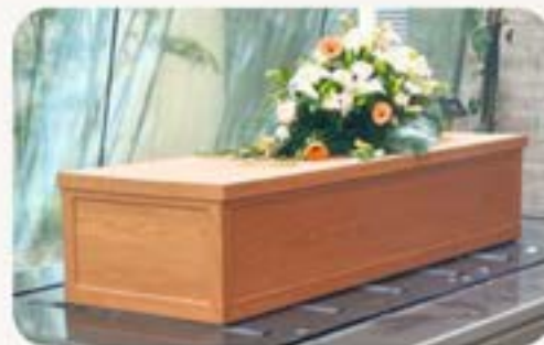
環保紙棺+棺面花球