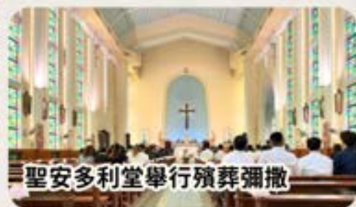
聖安多利堂舉行殯葬彌撒