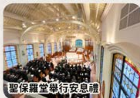
聖保羅堂舉行安息禮

家屬亦可選擇租用所屬教會的場地舉行儀式。如未有合適場地，一切從簡亦有合作的基督教場地可租用作舉行安息禮。