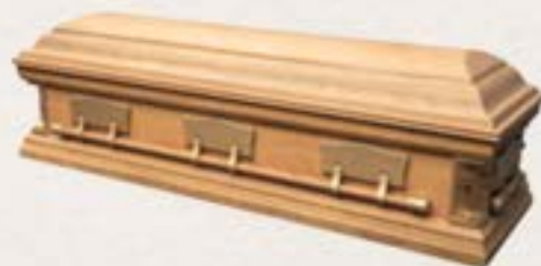
纖維板 - 十字角大蓋方箱 (橡木色)