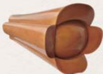
實木 - 中式棺木 (杉木蓮花)