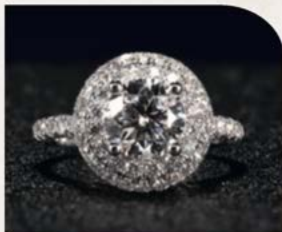
骨灰/毛髮紀念鑽石