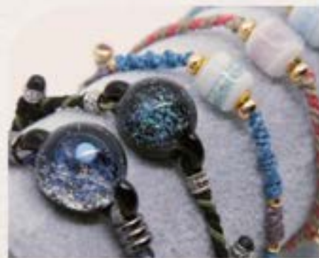
玻璃藝術家創作骨灰手繩