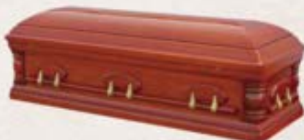
實木 - 杉木頭等仿美式棺