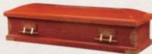
纖維板 - 羅白箱 (四抽) (香柏木色)