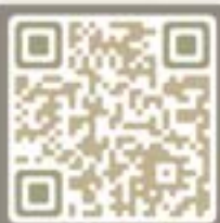
食環署 流產胎資訊