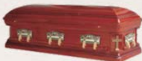
纖維板 - 十字角頭等仿美式棺 (柚木色) 配十二門徒最後晚餐抽板