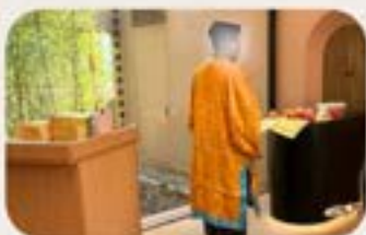
小天使中式火葬禮