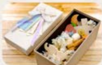
為24週以下小天使安葬

「一切從簡」團隊會主理的「愛兒告別禮」，由訃聞設計、棺木選擇、告別禮流程及佈置等提供專業意見，了解父母意願亦配合愛兒的需要或喜好，成為同行者支援過渡哀傷。