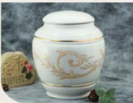
歐洲進口歐式骨灰盒