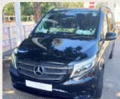
小型商務客貨車改裝靈車 20