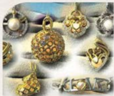
基因珍珠養殖紀念飾物