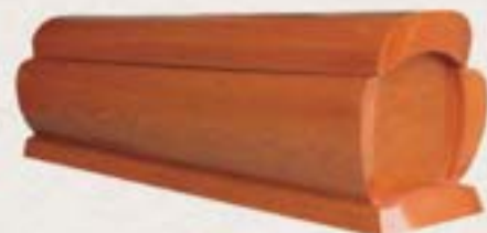
纖維板 / 蜂窩紙板 - 中式環保棺