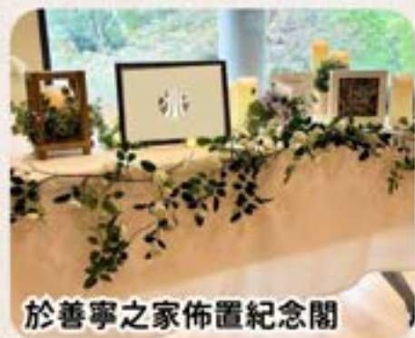
於善寧之家佈置紀念閣