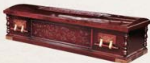
17 纖維板 - 精雕方箱