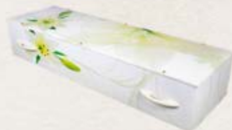
歐盟認可環保紙棺 (仙子百合)