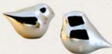
新式合金骨灰擺設

鑽石象徵著永恆、潔淨與堅強，將至愛的骨灰轉化成獨一無二的鑽石，象徵著永恆不變的愛一直伴隨，延續對逝者的思念與關係。家人亦可將骨灰接回家，容讓哀傷過渡，既是思念，也是陪伴。