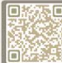
賽馬會「小足·福」 失胎支援計劃