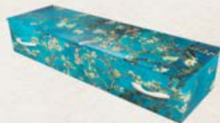
歐盟認可環保紙棺 (杏之花) 18