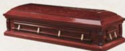
纖維板 / 蜂窩紙板 - 木紋長抽環保棺