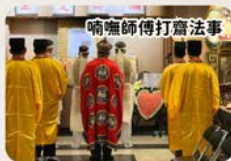
喃嘸師傅打齋法事