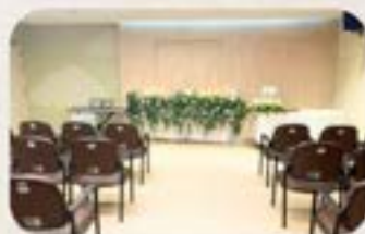
於兒童醫院進行告別禮