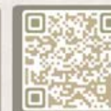
消委會 預備服務調查