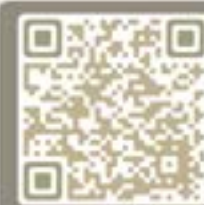
華永會 寧靜團資訊