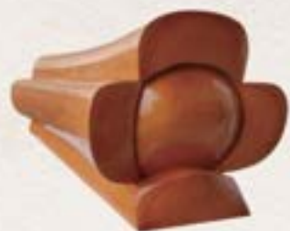
實木 - 中式棺木 (杉木八底 / 板庄)