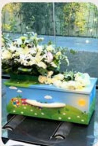
為嬰兒進行火葬禮