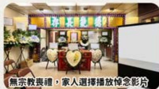
無宗教喪禮，家人選擇播放悼念影片