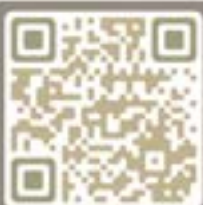
醫管局 流產胎資訊