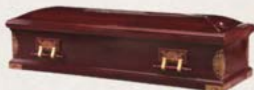
纖維板 - 羅白箱 (四抽) (酸枝色)