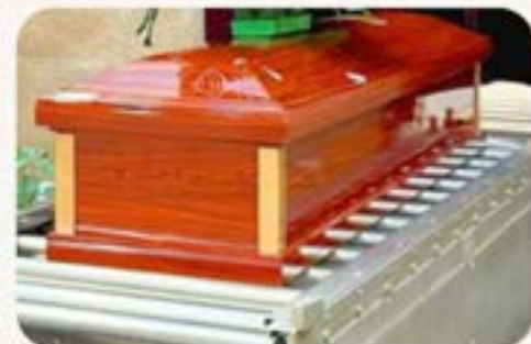
簡約日箱 (纖維木板)