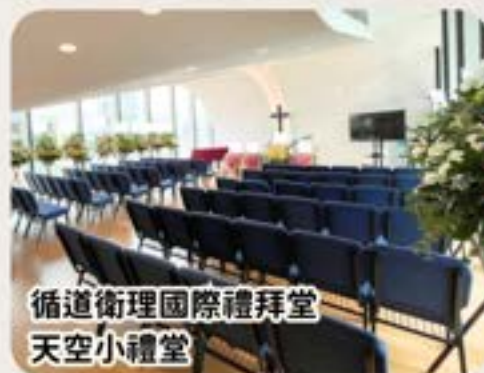
循道衛理國際禮拜堂 天空小禮堂