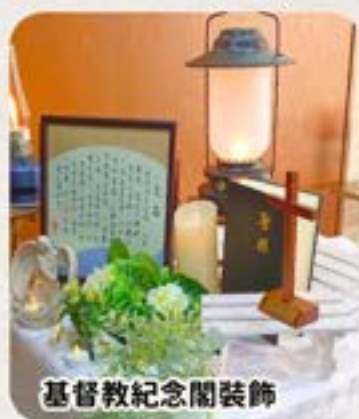
基督教紀念閣裝飾