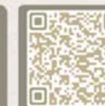
消委會 環保殯葬選擇