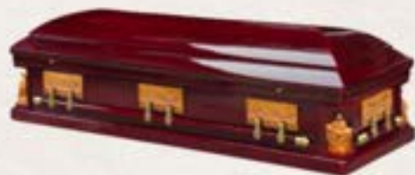
實木 - 沙比利木12門徒聖母耶穌棺