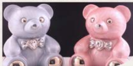
新式合金骨灰擺設 適合放在家中