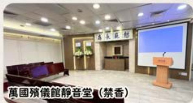
萬國殯儀館靜音堂（禁香）

此外，告別禮的場地同樣重要。部分殯儀館均設有靜音禁香禮堂，適合進行西式告別禮。另外，賽馬會善寧之家亦提供寧靜優雅的場所，讓公眾申請使用。