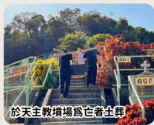
於天主教墳場為亡者土葬