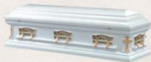
纖維板 - 十二門徒十字角大蓋方箱 (白色)