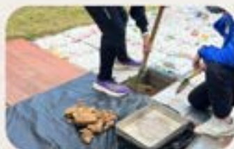
於永愛園為小天使安葬